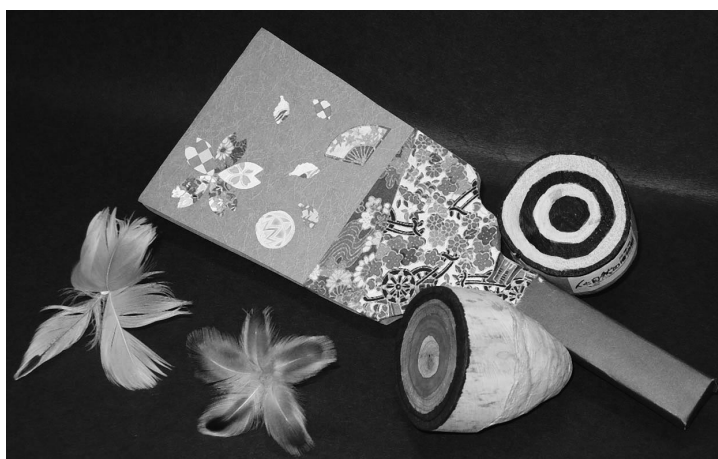
ネイチャー・クラフトクラブの作品