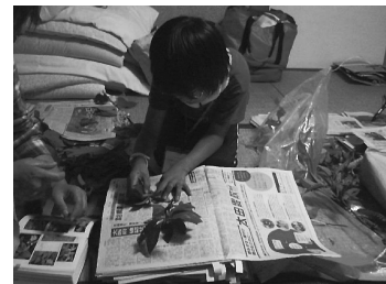
採集から標本づくりまで♪