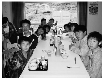
夕食時間はみんなで