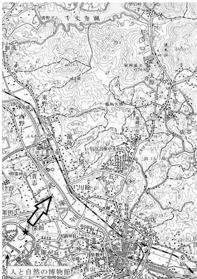
図2 図1に示した写真範囲の5万分の1地形図「三田」。左下隅の星印と矢印はそれぞれ図1に示した写真の撮影位置と撮影方向。写真と見比べてみると、武庫川低地では等高線の間隔があいていて等高線そのものの識別も難しい。大小の浅い谷に開析された北側の段丘地形に移行すると等高線の間隔がつまってくる。山地になると等高線の間隔はさらに狭くなる。有馬富士のような円錐形の独立峰では等高線は閉じている(同心円状になっている)ことに注意。国土地理院発行の5万分の1地形図「三田」を使用。