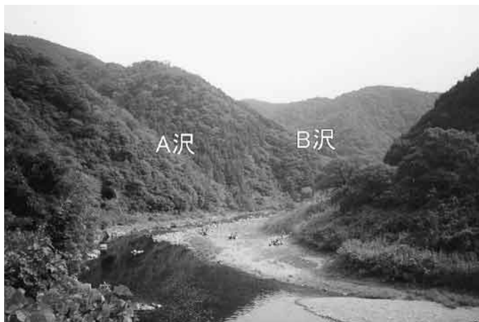
図3 JR武田尾駅北東600m地点から武庫川下流側を望む(図4参照)。A沢・B沢は図4のそれらに対応している。武庫川沿いには沖積低地は存在せず、山地が武庫川に迫りV字谷をつくっている。