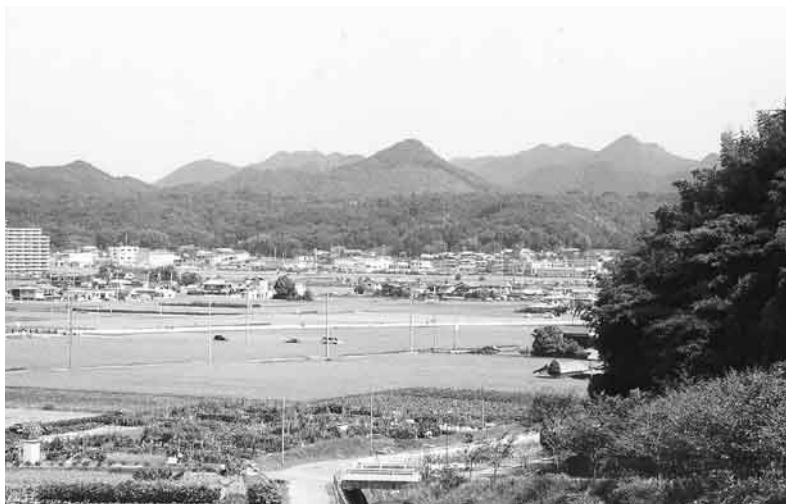
図1 兵庫県立人と自然の博物館北側の道路から北方を望む（図2参照）。博物館は武庫川南側の段丘面に位置していて、田圃や人家のある武庫川の低地（沖積面）を挟んで、武庫川対岸にはかつて南側の段丘に連続していた段丘が広がっている。その背後（北側）は小高い山地からなり、中央部の円錐形の山が有馬富士（374.4m）。