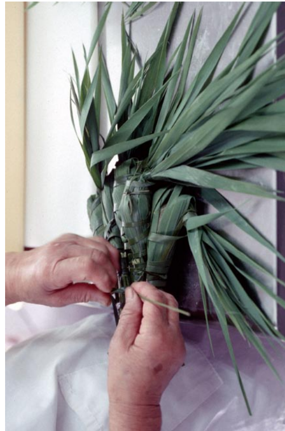
写真 1 5 ナラガシワとヨシを使用した団子 (2重に「つつんでしぼる」タイプ) (兵庫県宝塚市西谷のちまき) ③最後にシユロで縛る