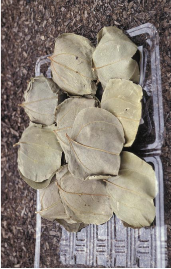
写真2 サルトリイバラを使用した団子（「はさむ」タイプ）（熊本県）