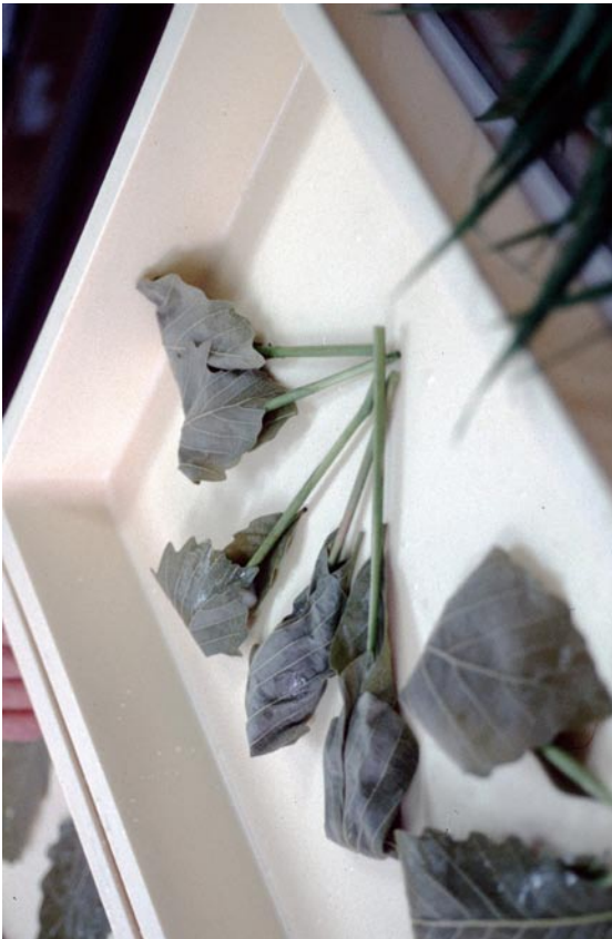
写真 1 3 ナラガシワとヨシを使用した団子 (2重に「つつんでしぼる」タイプ) (兵庫県宝塚市西谷のちまき) ①団子をナラガシワではさみ包み, ヨシの茎をさす