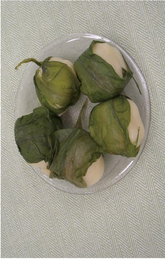
写真6 ミヨウガを使用した団子（「はさみつつむ」タイプ）（岐阜県）