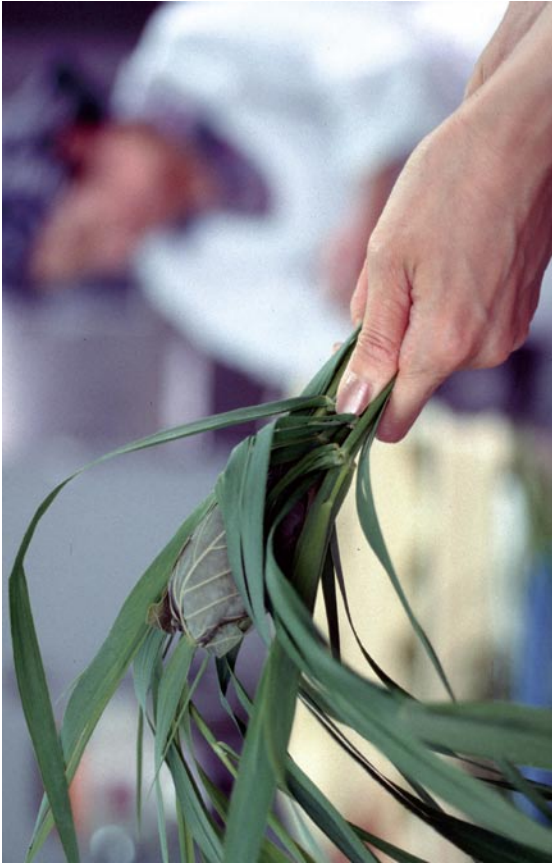
写真 1 4 ナラガシワとヨシを使用した団子 (2重に「つつんでしぼる」タイプ) (兵庫県宝塚市西谷のちまき) ②さらにヨシでまわりを被るように包む