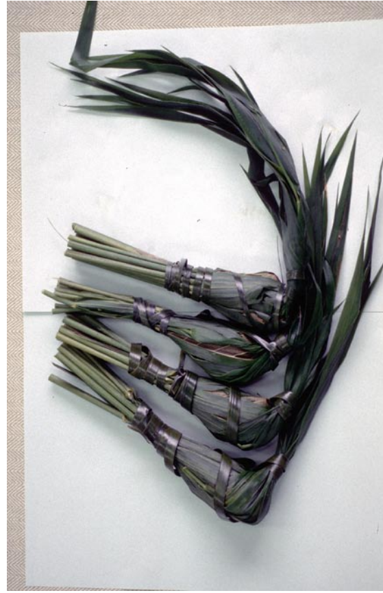
写真 1 6 ナラガシワとヨシを使用した団子 (2重に「つつんでしぼる」タイプ) (兵庫県宝塚市西谷のちまき) ④完成