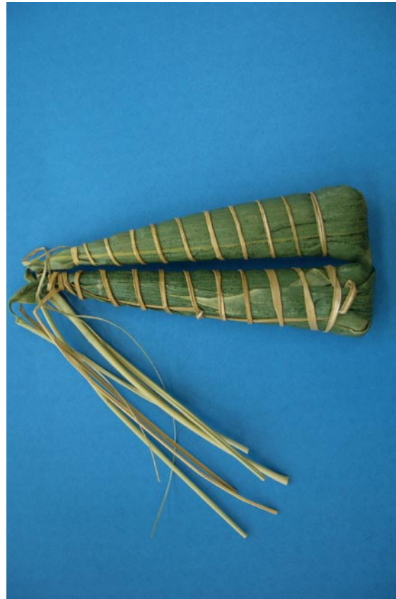
写真3 ササ類を使用した団子（「つつんでしぼる」タイプ）（山口県）