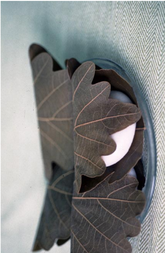
写真1 カシワを使用した団子（「はさみつつむ」タイプ）（岡山県）