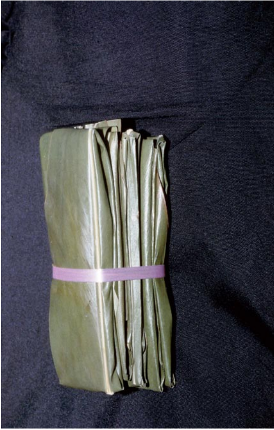
写真10 ゲットウを使用した団子（「つつんでしぼる」タイプ）（沖縄県）