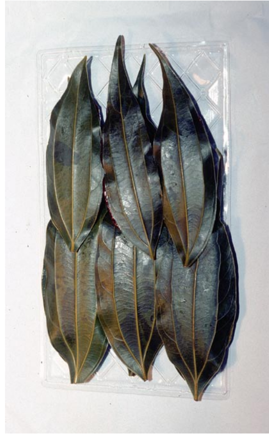
写真8 ニッケイを使用した団子（「はさむ」タイプ）（鹿児島県）