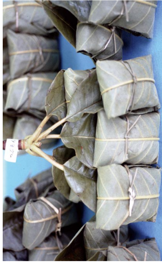
写真4 ホオノキを使用した団子（「つつんでしぼる」タイプ）（長野県）