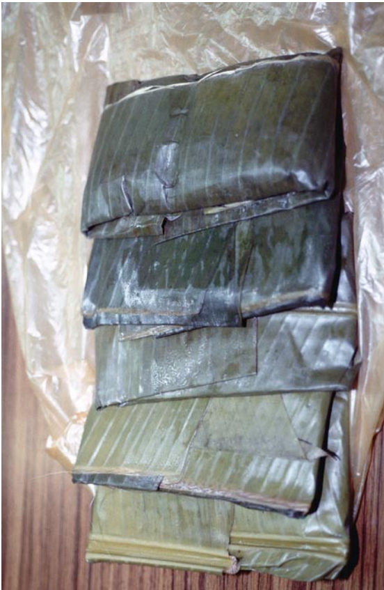
写真9 バシヨウを使用した団子（「つつんでしぼる」タイプ）（沖縄県）