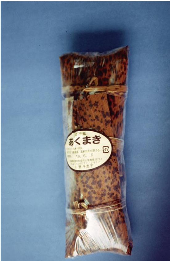
写真5 タケ類を使用した茹で飯（「つつんでしばる」タイプ）（宮崎県）