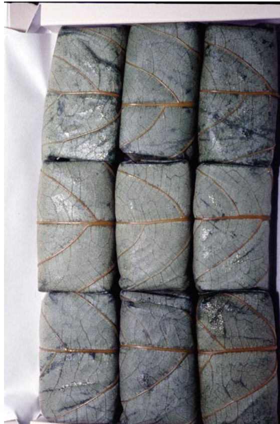
写真11 カキノキを使用した御飯（「つつむ」タイプ）（奈良県）