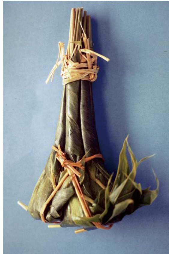
写真7 ササ類を使用した団子（「つつんでしばる」タイプ）（島根県）