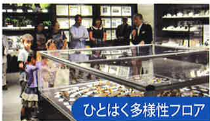
ひとはく多様性フロア

“モノ”と“ゴミ”が、豊かな暮らしのあり方や環境問題を問いかけます。動植物のすみかでもある自然と人とのつきあい方を考えた新しいまちづくりと生活スタイルを提案します。