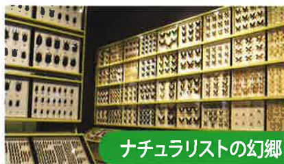
ナチュラリストの幻郷

南北とも海に接し、気候の変化が大きい兵庫県の特徴ある自然を大型パネル・映像・ジオラマなどで紹介します。「森に生きる」では兵庫県で見られる野生動物をはく製で紹介しています。