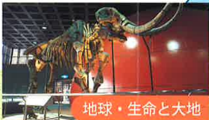
地球・生命と大地

海や川といった水中に暮らす生物の食物連鎖や水生生物による環境への適応について展示。ナガスクラの骨格標本やアオザメのはく製といった海に暮らす大型の生物や、河川における淡水魚の分布と生活を例にあげて生態系のしくみを解説しています。