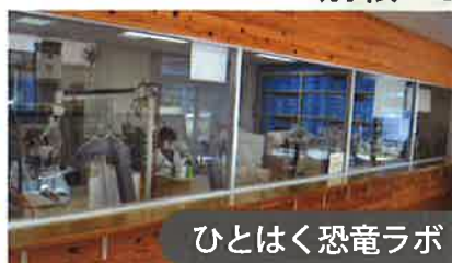
ひとはく恐竜ラボ

自由に閲覧できる「図書コーナー」や、自然環境についての最新の情報が集められている「情報コーナー」のほか、「休憩コーナー」などがあります。ワークショップやイベントが開催されます。