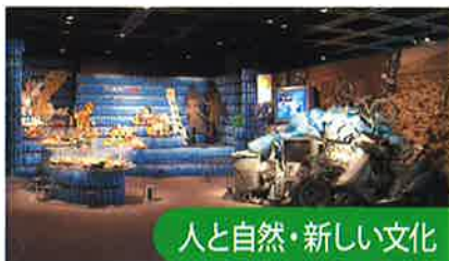
人と自然・新しい文化

恐竜化石のクリーニング作業及び展示等を行う施設として「ひとはく恐竜ラボ」が2008年4月にオープンしました。研究員などによる作業風景を間近に見ることができます。