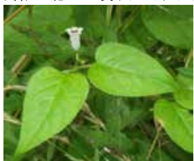
ヤイトバナの葉と花