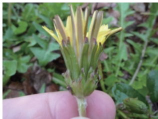
ヤマザトタンポポ