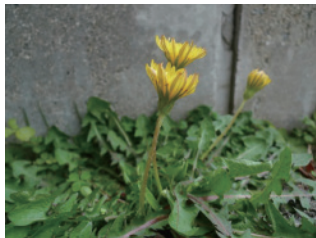
カンサイタンポポ

今回特筆すべきは企業（NTT 西日本、三菱電機）の参加です。当初は資金協力をお願いしていたのですが、CSR 事業として、社員がタンポポ調査に参加いただきました。特に NTT 西日本社員の方々は西日本全域 1000 件以上のサンプルとさまざまな感想をいただきました。