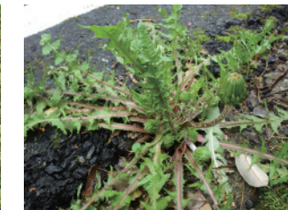
オオクシバタンポポ