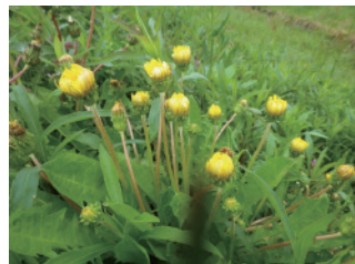
セイタカタンポポ