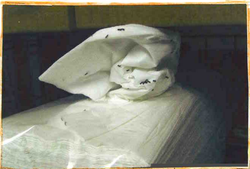
ティッシュを食べていた。たくさんのアリがいた。