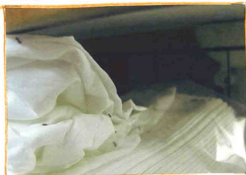
1回目より奥にいた。1回目より穴が深かった。