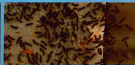
7/26 1匹ごごの孵化した